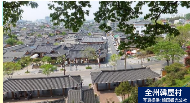
全州韓屋村