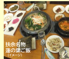
扶余名物 蓮の葉ご飯 (イメージ)

全州マッコリタウンおつまみ料理セット(イメージ) マッコリとテーブルいっぱいのおつまみ料理で伝統的な韓国の食文化を体験