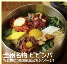
全州名物 ビビンバ(イメージ)

韓国絶品グルメ30選とは、日本の旅行業界のプロが選んだ韓国の地域別に厳選されたご当地グルメです。名物料理を本場でお楽しみください。