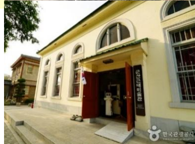
群山近代美術館

かつて長崎地盤の地銀・第十八銀行 群山支店の建物を補修・復元して、現在は美術館として利用されています。