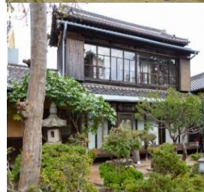
日本式家屋(広津家屋)

かつて長崎地盤の地銀・第十八銀行 群山支店の建物を補修・復元して、現在は美術館として利用されています。