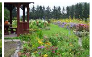
約18,000坪の敷地に2,500種類の花々が咲き、花を愛した人々の思いや歴史が息づいています。