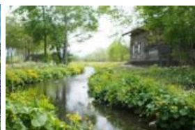
十勝六花をはじめ、四季折々の山野草が咲く園内で、自然の風景やアート作品を楽しめます。