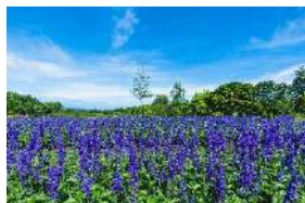
季節ごとに表情を変える花々や、野菜や果樹などをテーマにしたガーデンがあなただけをお迎えます。