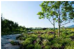
日高山脈のふもとにあり圧倒的なスケールの自然と多彩な庭を楽しむ。