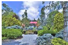
日本初のコニファーガーデンとして有名。開拓以前から残る貴重なコレクションは見応えがあります。