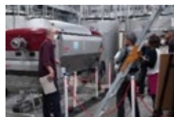
施設内を解放付きでご案内