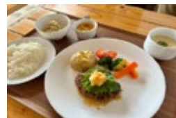
彩り野菜を添えた 煮込みハンバーグの昼食