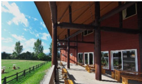
ドメーヌレゾン (テラスからは飼育しているヤギの姿も)