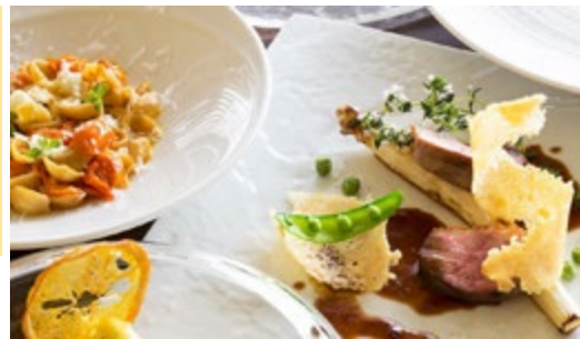
フラテットロ・ディ・ミクニ イタリアンのコースランチ (イメージ) *ドレスコード不要