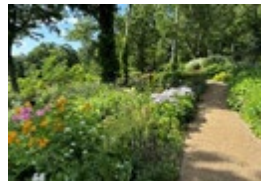
大雪森のガーデン

旅のポイント フレンチの巨匠・三国清三シェフのフレンチと北海道イタリアンの第一人者・堀川秀樹シェフのイタリアンを融合した人気のレストランでコースランチをご賞味。隣接する大雪森のガーデンでは3つのエリアで構成される庭園の散策を楽しめます。2017年に地域再生の象徴として誕生した上川大雪酒造にも立ち寄ります。