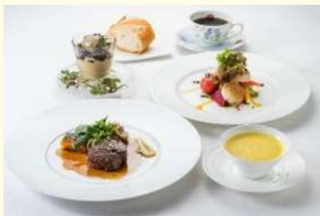
「グリル銀鱈荘」の昼食 (イメージ)

※コースは、スープ、前菜、お肉料理、デザート、食後のお飲み物となります。 ※正装の必要はございません。