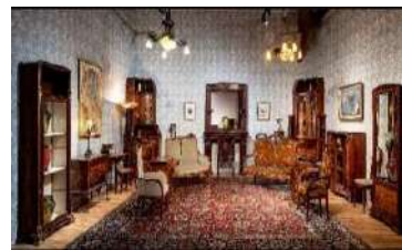
アール・ヌーヴォー様式の室内再現展示 (西洋美術館)