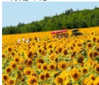
北竜町・ひまわりの里

三國清三シェフ監修のホテルとして宿泊施設を備えたレストラン。地産地消にこだわった、新鮮な山海の幸を使ったお食事をお楽しみください。