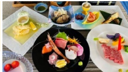
オーベルジュましけ創作会席イメージ(全6~7品となります) *ドレスコード不要