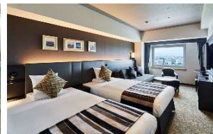
ツインルーム イメージ