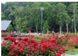
いわみざわ公園 バラ園

旅のポイント 北海道ガーデン街道のひとつ、旭川市にある「上野ファーム」をはじめ、見頃を迎える「いわみざわ公園」のバラ園にもご案内。昼食はアートホテル旭川15階にあるビュッフェレストランにて、全60種類ほどのバイキングをお楽しみください。