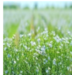
当別町 畑一面に広がる 可憐な亜麻の花