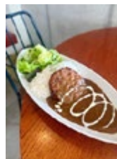
Cafe & Kitchen Offshore ハンバーグカレー

北海道産の亜麻仁油100%を使用。素材を引き立てるたまねぎ味でさっぱりと美味しくいただけます。