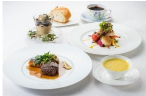
「グリル銀鱗荘」の昼食 (イメージ)

*コースは、スープ、前菜、お肉料理、デザート、食後のお飲み物となります。 *正装の必要はございませんが、ジャージなどの軽装は避けてください(ジーンズ、スニーカーなどは問題ございません)。