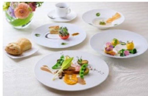
ザ・ウィンザーホテル洞爺 ギリガンズアイランド 昼食(イメージ) *正装の必要はございませんが、ジャージなどの軽装は避けてください(ジーンズ、スニーカーなどは問題ございません)。

旅のポイント ザ・ウィンザーホテル洞爺「ギリガンズアイランド」で季節の食材を活かしたフレンチランチを楽しみます。花の寺として知られる有珠善光寺では見頃を迎えるアジサイの観賞と国指定重要文化財などが展示される宝物館へご案内します。