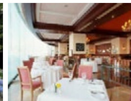
ザ・ウィンザーホテル洞爺 ギリガンズアイランド店内