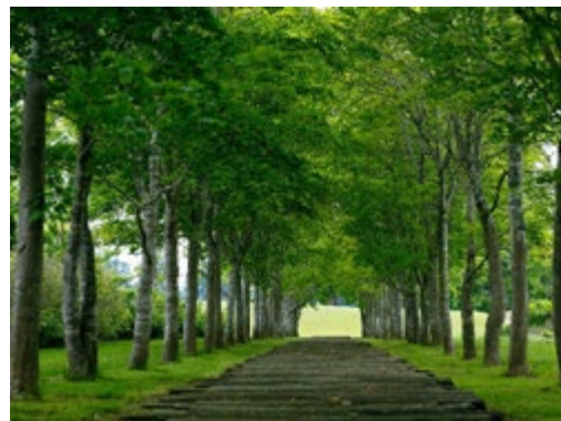
中札内美術村 山もみじのトンネル