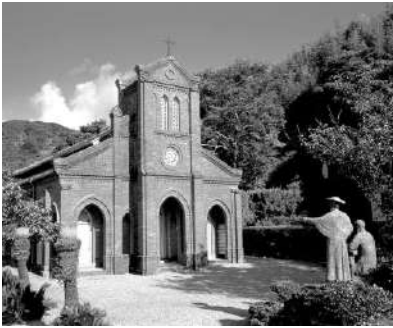
【2日目見学：堂崎天主堂】