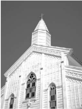
【2日目見学：水ノ浦教会】