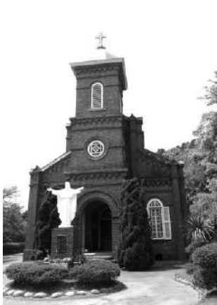
【3日目見学：大曾教会】