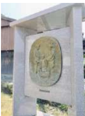
小泉八雲記念公園レリーフ