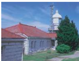
美保関灯台 (日本最古の石造り灯台)