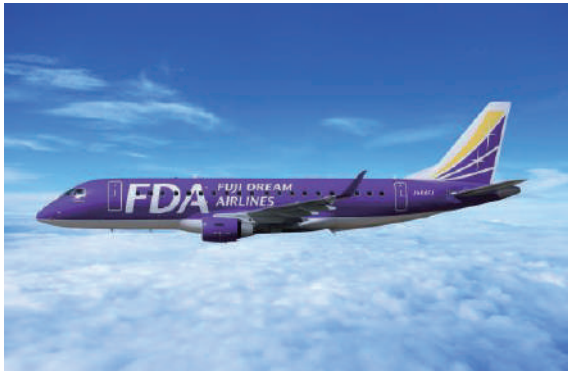
フジドリームエアラインズ(イメージ)