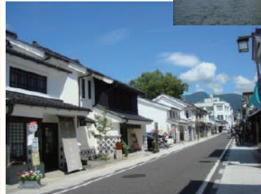
中町通り(目的地イメージ)