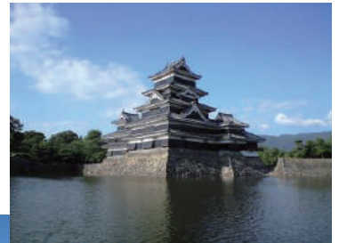
松本城(目的地イメージ)