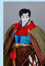
アシタカ＝市川團子