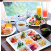
ホテルグレイスリー田町