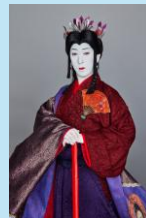
エボシ御前＝中村時蔵