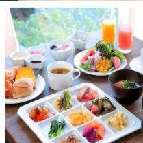
ホテルグレイスリー田町 外観・客室と朝食の一例

JR 山手線田町駅から徒歩約5分、近辺にレストランやスーパーもあり便利で、綺麗なホテルです。旬の野菜を使ったbuffetの朝食も評判です。