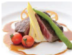
マリーニルージュ昼食