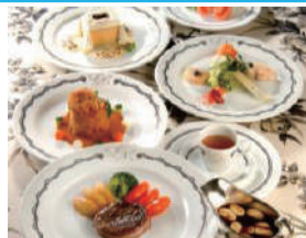
1日目夕食イメージ