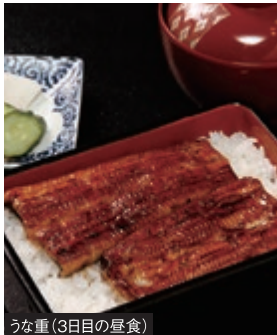
うな重(3日目の昼食)