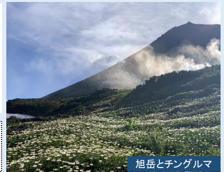
旭岳とチングルマ

道新ビル前(7:50集合) 8:00発=<高速利用>=○旭岳・姿見の池ハイキング (●大雪山旭岳ロープウェイで姿見駅へ。高山植物を探しながら姿見の池周辺を歩きます) <180分>・・・●旭岳温泉ベアモンテ(入浴)<50分>=<高速利用>=JR札幌駅=地下鉄大通駅=道新ビル前19:00頃 ■食事/1昼付(弁当)