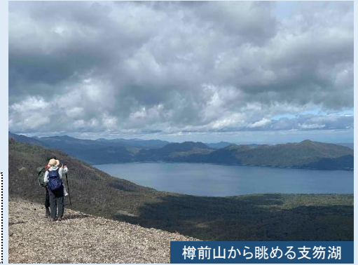
樽前山から眺める支笏湖

昨年登山道の修復工事が行われた樽前山に登ります。高山植物タルマエソウ(イワブクロ)が見られる時期です。登山後は温泉入浴へ。