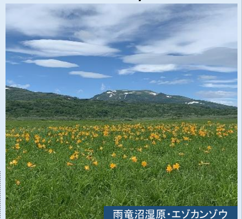
雨竜沼湿原・エゾカンゾウ

道新ビル前(7:20集合) 7:30発=○雨竜沼湿原トレッキング(南暑寒荘から雨竜沼湿原を目指します) <300分>=●滝川ふれあいの里(入浴)<50分>=JR札幌駅=地下鉄大通駅=道新ビル前19:40頃 ■食事/1昼付(弁当) ※体力を要するコースです。歩き慣れていない方の参加はご遠慮ください。