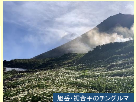
旭岳・裾合平のテングルマ

絶景の旭岳へロープウェイで姿見駅へ。その後緩やかな起伏をす すみ、雪渓とテングルマの花畑を歩きます。