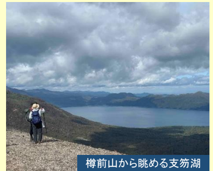
樽前山から眺める支笏湖

高山植物エゾイソツツジ、マルバシモツツゲなど、樽前山らしい白系の花が 見頃を迎える時季です。登山後は温泉入浴へ。