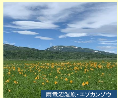
雨竜沼湿原・エゾカンゾウ

北海道の高層湿原の代表格、雨竜沼湿原を歩きます。 下山後は、温泉入浴も立ち寄りませう。