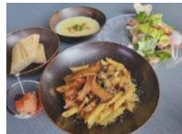
ココースタイルニセコHANAZONO (前菜、サラダ、スープ、パスタを予定)