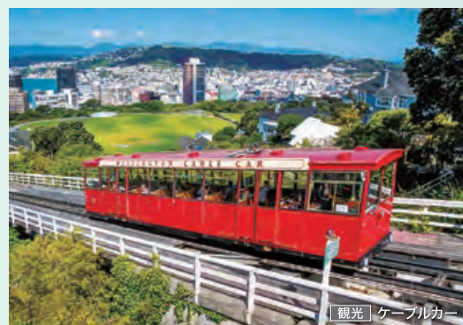
観光 | ケーブルカー

観光 | 紙の大聖堂とクライストチャーチゴンドラ、アーサーズバス国立公園とトランツアルパイン鉄道 ほか