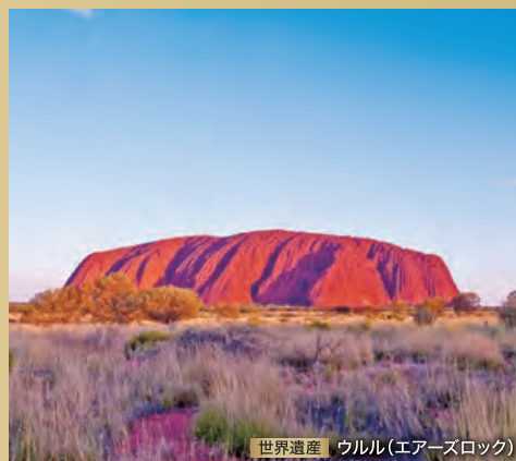
世界遺産 | ウルル(エアーズロック)

陸路や空路で内陸観光をお楽しみいただく宿泊を伴うツアーです。なかなか訪れることのできない絶景へご案内します。