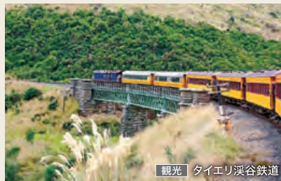
観光 | タイエリ溪谷鉄道

19世紀に誕生した、ケアンズからキュランダまでを結ぶ観光列車。世界遺産バロン溪谷国立公園の熱帯雨林を走ります。