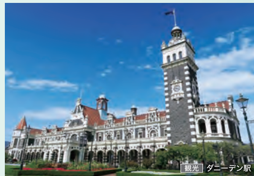
観光 | ダニーデン駅

今回訪れるニュージーランドの寄港地はなんと6都市。世界有数の美しさを誇る星空や氷河が削ったフィヨルド、間欠泉、原生林、美しいビーチなど、ここにしかない地球のダイナミズムをご体験いただけます。ヨーロッパの趣ある街並みや列車旅、豊かな食文化も見逃せません。