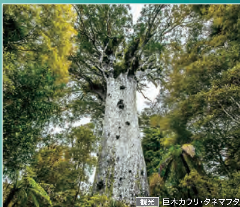
観光 | 巨木カウリ・タネマフタ