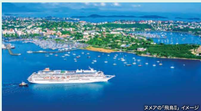
ヌメアの「飛鳥II」イメージ