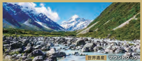
世界遺産 | マウントクック

巨大な一枚岩が鎮座する、オーストラリア中央部のアボリジニーの聖地ウルル(エアーズロック)へ。