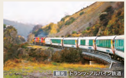
観光 | トランツ・アルパイン鉄道

繊細で美しいダニーデン駅からタイエリ溪谷へ向かう観光列車。荒々しい岩肌やダイナミックな丘陵など、豊かな風景の中を進みます。