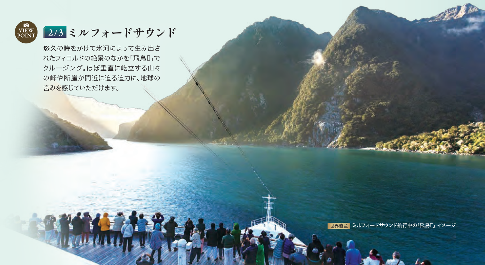
世界遺産 | ミルフォードサウンド航行中の「飛鳥II」イメージ

悠久の時をかけて氷河によって生み出されたフィヨルドの絶景のなかを「飛鳥II」でクルージング。ほぼ垂直に屹立する山々の峰や断崖が間近に迫る迫力に、地球の営みを感じていただけます。