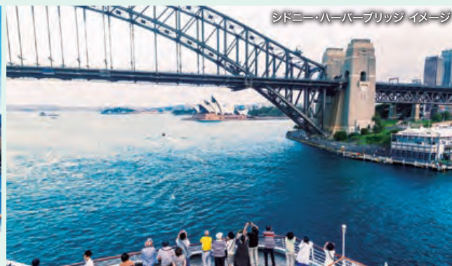
シドニー・ハーバーブリッジ イメージ