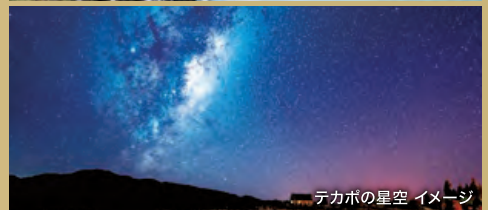
テカポの星空 イメージ