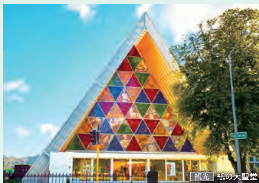
観光 | 紙の大聖堂