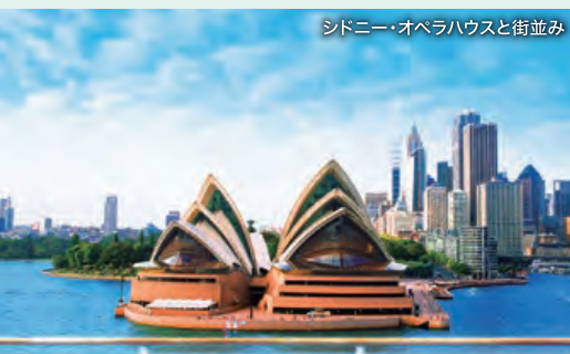
シドニー・オペラハウスと街並み