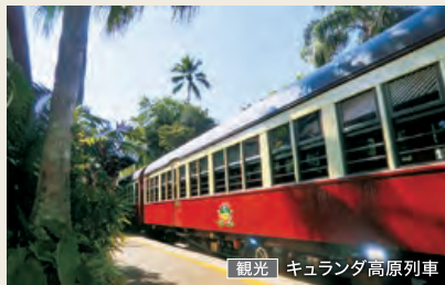
観光 | キュランダ高原列車

広大な国土を持つオーストラリアや自然豊かなニュージーランドでは、景観を鉄道で楽しむ旅が人気。寄港地観光ツアー(別料金・定員制)で列車の旅をご用意しましたので、ぜひこの機会にご体験ください。