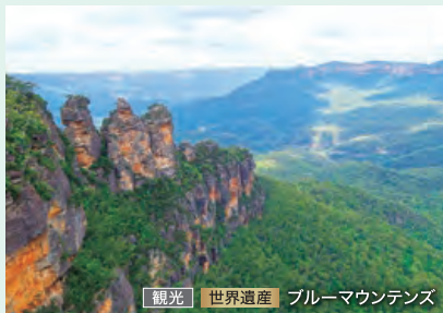
観光 世界遺産 ブルーマウンテンズ