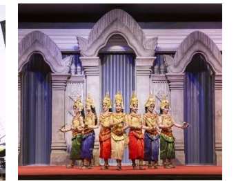
クメール伝統舞踊アブサラダンス