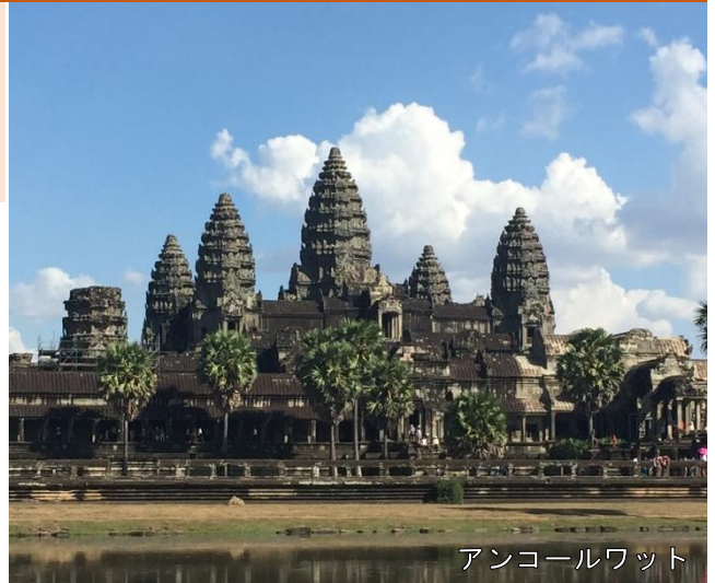
アンコールワット

12世紀前半に建てられたヒンズー教寺院。寺院を囲む広大な濠と参道、3つの回廊、5基の塔からなる。「世界遺産ランキング」で常に上位にあがる人気の遺跡です。