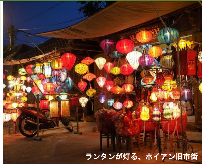
ランタンが灯る、ホイアン旧市街

古い街並みが残る古都ホイアン。16世紀には朱印船貿易により移住した日本人街がありました。夜になれば色鮮やかなランタン街を彩り、旧市街はより華やかな雰囲気のにぎわいます。