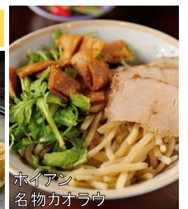
ホイアン 名物カウラウ