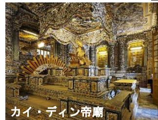
カイ・ディン帝廟