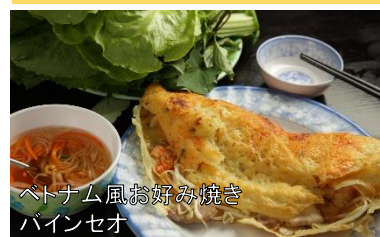
ベトナム風お好み焼き バインセオ