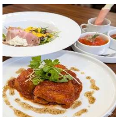
メイン: 鶏もも肉のソテー トマトと味噌のアッサンブル

道南食材をふんだんに使ったサラダ、彩り豊かな前菜3種、香ばしく焼き上げたメインのお肉料理、バゲットが並ぶコースランチ。昼食時には赤ワインと2023年のシャルドネ(初収穫ヴィンテージ)の白ワインそれぞれグラスワイン1杯ずつお楽しみいただけます。ぶどう畑と函館湾を望む絶景の中で、ゆったりとご堪能ください。