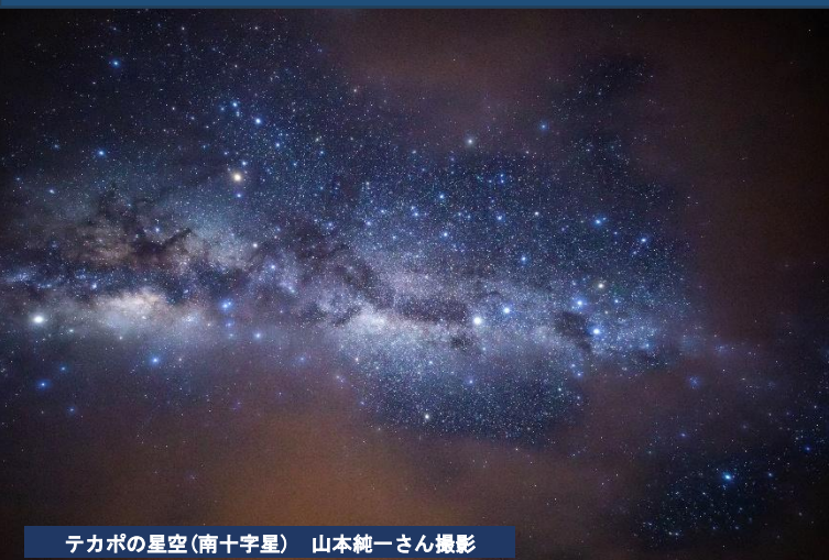
テカポの星空(南十字星)