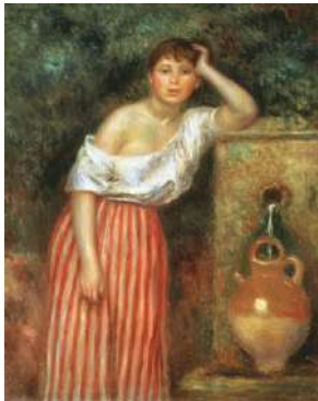
ピエール＝オーギュスト・ルノワール 《泉のそばの少女》1887年 油彩・カンヴァス

19世紀から20世紀にかけて、フランスを中心とする美術界では、次々と新しい美術の潮流が生まれました。光によって変化する自然の姿や都市の近代生活を鮮やかな色彩で描き出した印象派の画家たちは、後の美術界に多大な影響を与え、ポスト印象派やフォービスムの画家が登場します。1920年代になると、パリにはさまざまな国から芸術家が集まり、特定の様式や流派にとらわれず、個々の表現を追求した画家たちは、エコール・ド・パリ(パリ派)と呼ばれるようになりました。本展は、茨城県笠間市にある笠間日動美術館の西洋絵画コレクションより、モネやルノワールら印象派から、エコール・ド・パリまで選りすぐった作品によってフランス近代絵画の魅力をご紹介します。