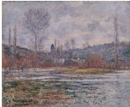
クロード・モネ「ヴェトゥイユ、水びたしの草原」 1881年 油彩・カンヴァス