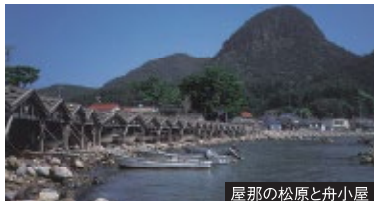
屋那の松原と舟小屋

旅のポイント 島根沖に浮かぶ、4つの主島と大小180あまりの島々からなる隠岐の島。断崖絶壁や奇岩など雄大な海岸風景が多く見られ、また「後鳥羽上皇」や「後醍醐天皇」の遠流先となったため、史跡も数多く残っています。隠岐の島の魅力をたっぷりめぐる旅です。