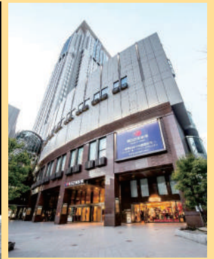
梅田芸術劇場外観