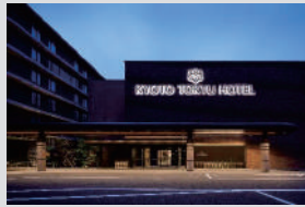
京都東急ホテル 外観

京都東急ホテルは西本願寺に隣接する閑静な佇まいのホテルです。中庭を流れる滝や川、端正な竹林が古都の風情を演出し、洗練されたモダンな和の空間で、やすらぎのひとときをお過ごしいただけます。