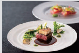
一日目洋食 (イメージ)