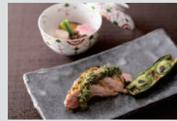
2日目和会席追加プラン (イメージ)