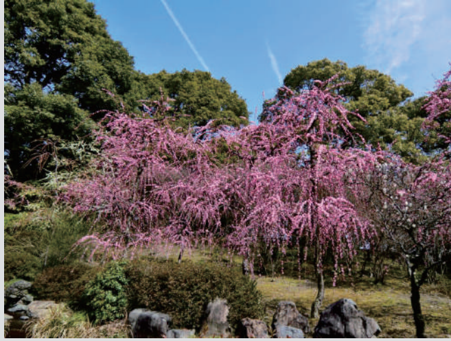
城南宮のしだれ梅と京都市内各地の梅の花 (イメージ)