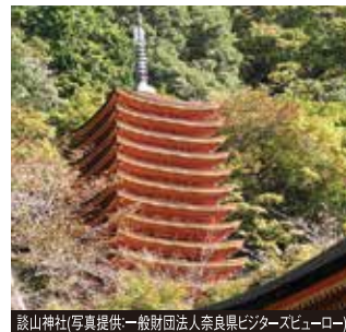
談山神社

巨石30個を積み上げて造られた石室古墳。6世紀の築造で、その規模は日本最大級を誇ります。