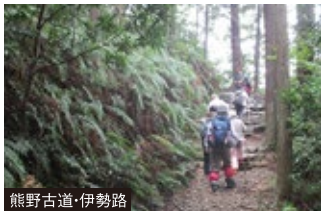
熊野古道・伊勢路