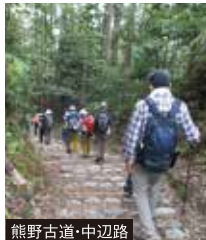
熊野古道・中辺路