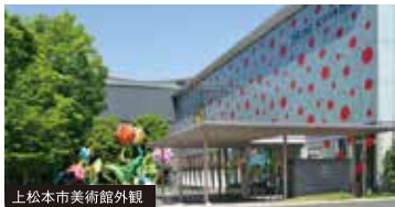
上松本市美術館外観