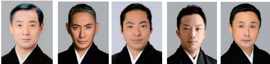
中村魁春 市川團十郎 市川中車 市川猿之助 中村雀右衛門

★プログラム・出演者などの内容は主催者側の事情で変更の場合がありますが、当社では一切責任を負いません。出発後に興行が中止の場合、チケット代金以外は払い戻しいたしません。 ★お座席は希望を承ることはできません。当日添乗員よりご案内いたします。 ★歌舞伎座 1等席利用 イヤホンガイド付