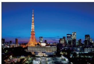
ザ・プリンスパークタワー東京 外観・客室一例