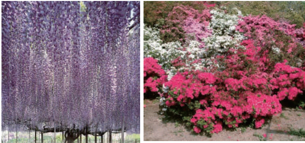
ふじの花(左)とつつじ(上)