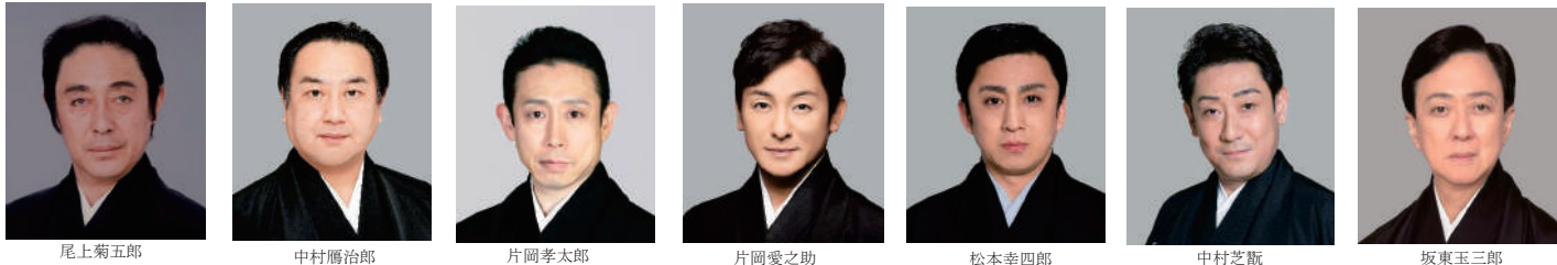
尾上菊五郎 中村鴈治郎 片岡孝太郎 片岡愛之助 松本幸四郎 中村芝翫 坂東玉三郎

★歌舞伎座でのお弁当は熟食でお願いいたします。★客席内での会話や発声はお控えください。★歌舞伎鑑賞中および団体ツアー中はマスクをご着用ください。★お座席は希望を承ることはできません。当日添乗員よりご案内いたします。 ★プログラム・出演者などの内容は主催者側の事情で変更の場合がありますが、当社では一切責任を負いません。出発後に興行が中止の場合、チケット代金以外は払い戻しいたしません。