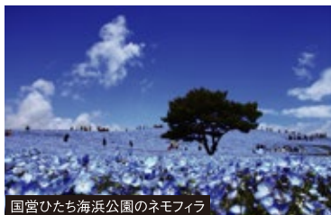
国営ひたち海浜公園のネモフィラ