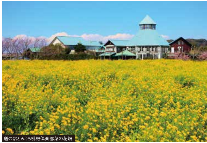
道の駅とみうら枇杷倶楽部菜の花畑