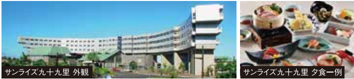
サンライズ九十九里 外観

九十九里浜に舟の帆のようにゆったりとカーブを描いて建つ個性的な外観で、全客室が太平洋に面しています。展望大浴場からも海が一望できます。