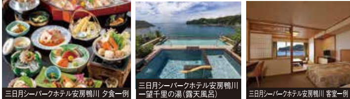
三日月シーパークホテル安房鴨川 夕食一例

地上35m露天風呂「一望千里の湯」や「誕生の湯」など充実の温浴施設でおくつろぎください。