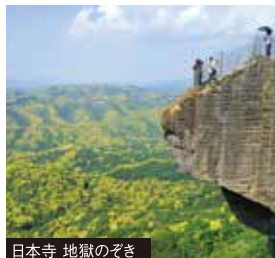
日本寺 地獄のぞき

世界でも珍しい写実絵画の専門美術館で、主に現代の日本人画家による細密画を収集・展示している。