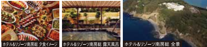
ホテル&リゾート南房総 夕食イメージ