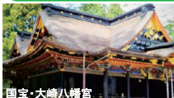
国宝・大崎八幡宮

ツアーのポイント 普段の一般拝観では廊下からしか見学できない国宝・瑞巖寺の本堂を、僧侶の案内で各部屋の中に入り見学する特別拝観や、通常遊覧では航行しない航路を通っての松島湾貸切船遊覧など、いつもとは一味違う「日本三景・松島」をお楽しみいただきます。また、東北一のいちご産地でのいちご狩りや名湯に宿泊するなど、宮城県を満喫いたします。