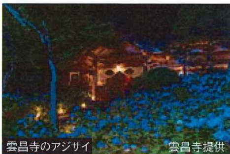
雲昌寺のアジサイ

北秋田市の鷹巣駅と仙北市の角館駅を南北に結ぶローカル線で四季を通じて里山風景と大自然の景色を車窓からお楽しみいただけます。