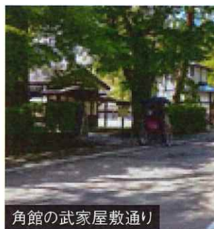
角館の武家屋敷通り