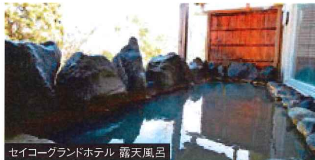
セイコーランドホテル 露天風呂