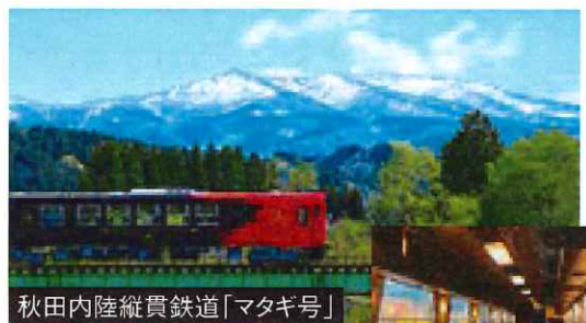
秋田内陸縦貫鉄道「マタギ号」

2日目/田沢湖高原温泉:プラザホテル山麓荘 和室または洋室または和洋室利用(バス・トイレ付)