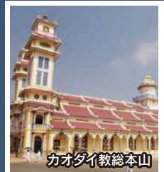
カオダイ教総本山