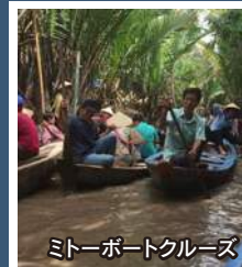
ミーポートクルーズ