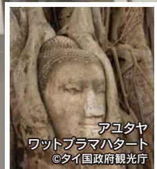
アユタヤ ワットプラマハタート