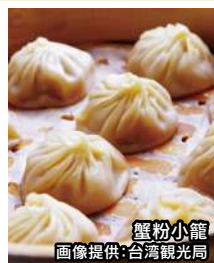
蟹粉小籠