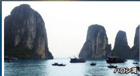
ペリカン号と初日の出

5 5:05/ソウル着(KE680便) [所要時間/3時間55分] 10:05/ソウル発 ▶ 12:45/新千歳着(KE765便) [所要時間/2時間40分] ㊟ ㊟ ㊟