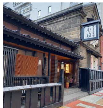
上：きょうど料理亭 杉ノ目外観 左：芦沢料理長