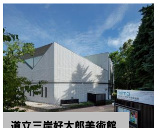
道立三岸好太郎美術館

道新ビル大通館前 9:30 発 ===== ●札幌芸術の森野外美術館 (ボランティアの解説付きで野外展示彫刻を鑑賞) <90分> ===== きょうど料理亭 杉ノ目 (札幌軟石づくりの蔵が目を引く老舗料亭にて季節の会席料理のご昼食) <90分> ===== ●道立三岸好太郎美術館 (コレクション展鑑賞) <60分> ..... ●道立近代美術館 (コレクション展鑑賞) <60分> ===== 16:00 ころ道新ビル前 ===== 16:15 ころ JR 札幌駅北口