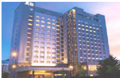
【センチュリーマリーナ函館外観】

観光拠点としても便利な駅前地区に立地しており、自慢の天空露天風呂からは函館の夜景や函館山が広がります。地元の素材をふんだんに使用している朝食ビュッフェが大人気のホテルです。