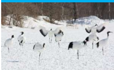
冬の丹頂鶴

レストランはなしのぶでは地元生産者から直接仕入れた農産物を提供する「地産地消」の取り組みに力を入れております。