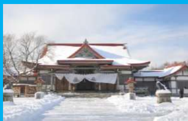
釧路厳島神社

阿寒国際ツルセンターは冬期の間、人工給餌を行っており野生の丹頂が多い時で150羽以上飛来します。研究員が生態・行動の研究を目的とした国内唯一のタンチョウのための施設でもあります。